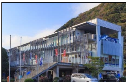
代表施設「開国下田みなと」