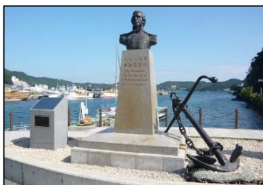
ペリー上陸記念公園