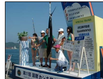
国際カジキ釣り大会