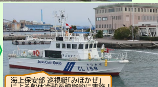
海上保安部 巡視船「みみかぜ」 による船体冷却を模擬的に実施！