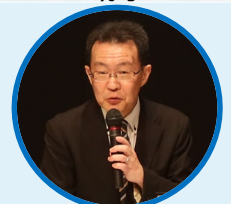
中原 正顕 (国土交通省 中部地方整備局副局長)