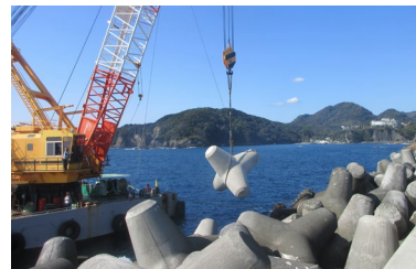
防波堤 消波ブロック据付 (R7.11)