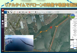
リアルタイムでドローンの映像や軌跡を確認