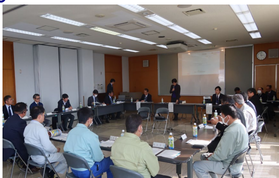
第4回 田子の浦港脱炭素化推進協議会の様子

2月20日、第4回田子の浦港港湾脱炭素化推進協議会(事務局:静岡県)が開催され、令和6年9月に設立した第1回協議会からの議論を経て、3月18日に「田子の浦港港湾脱炭素化推進計画」が公表されました。このことにより、中部管内(静岡県、愛知県、三重県)の重要港湾以上の全ての港でCNP形成に向けた計画が策定されました。