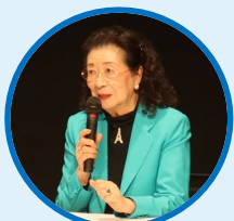
石井 幹子 (照明デザイナー) (株式会社石井幹子デザイン事務所 代表)