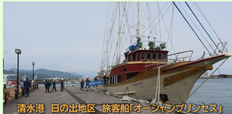
清水港 日の出地区 旅客船「オーナガブリンスス」