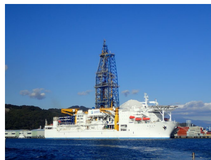
興津埠頭に停泊する探査船「ちきゅう」

本船は、スマートフォンや電気自動車、風力発電など、現代の先端技術に不可欠なレアアース(希土類)元素を含む泥を海底から引き上げるシステムの試験のため1月12日に清水港を出港し、南鳥島沖(東京)の水深約6,000mからの揚泥を世界で初めて成功させ2月14日に帰港しました。