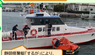
静岡県警「するが」により、 救命筏に移動した乗客を救助！