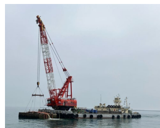
②波除堤の撤去作業(R7.6)