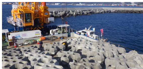
外港防波堤 被覆ブロックの設置(R8.1)

大規模地震・津波による防波堤の倒壊を防ぐため、「粘り強い構造※」への改良工事を進めます。