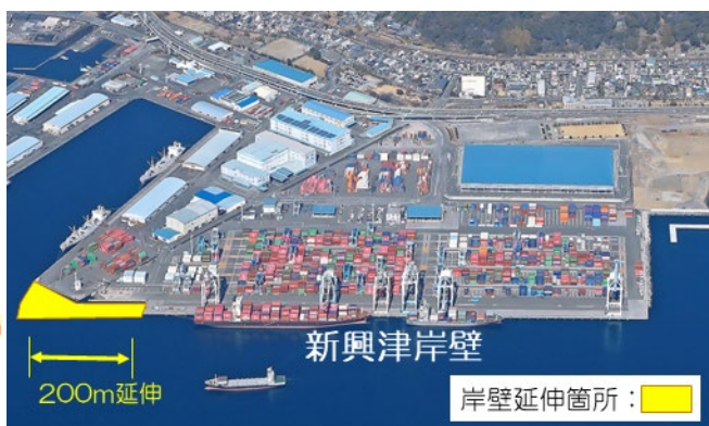
新興津岸壁延伸事業の概要