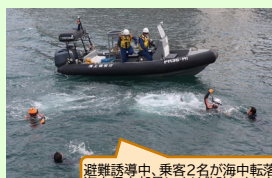
避難誘導中、乗客2名が海中転落、 海上保安部員により救助しました！