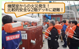
機関室からの火災発生！ 比較的安全な2階デッキに避難！