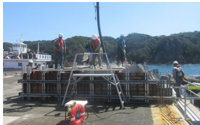
防波堤上部工事 コンクリート打設 (R7.9)

荒天時の船舶の避難場所として利用されてきた下田港において、船舶が安全に避難できる静穏な水域を確保するとともに、東海地震などによる津波から市街地を防護するため、防波堤の整備を進めます。