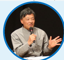
難波 喬司 (静岡市長)