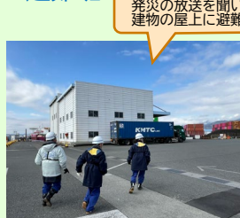
発災の放送を聞いて、 建物の屋上に避難しました！