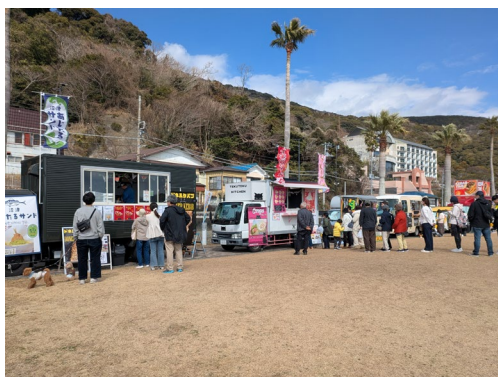
芝生広場に並ぶキッチンカーと行列

2月21日・22日に、みなとオアシス下田の構成施設である、まどが浜海遊公園にて実証実験としてキッチンカーフェスタが初開催されました。同イベントは県内外から延べ約40台のキッチンカーが集結し、2日間で延べ約3,500人が来場しました。富士宮焼きそばなどご当地グルメを求め、長い列ができるなど、会場は大いに盛り上がりました。