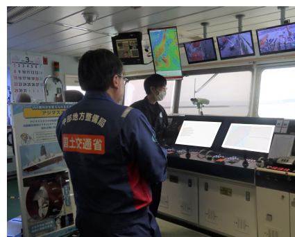
船内での見学の様子