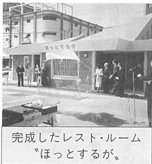
完成したレスト・ルーム「ほっとするが」