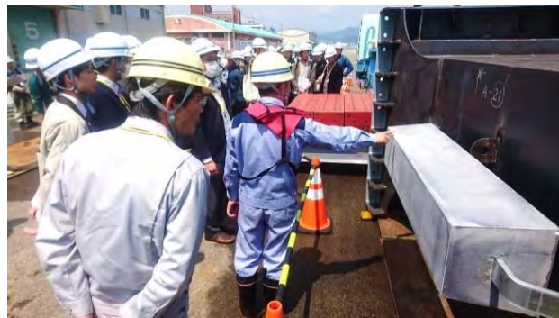
〈実際に使用する深梁を見学〉