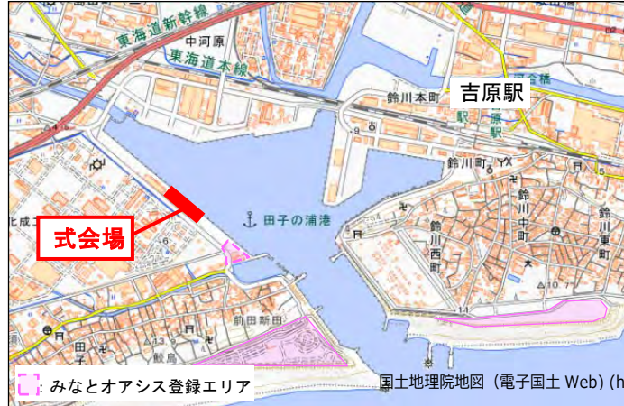
国土地理院地図 (電子国土 Web) ( http://maps.qsi.go.jp )をもとに国土交通省作成

※FAXの場合は到着確認のご連絡をお願い致します。(TEL : 054-352-4148)