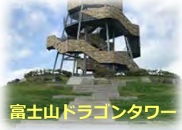
富士山ドラゴントワー