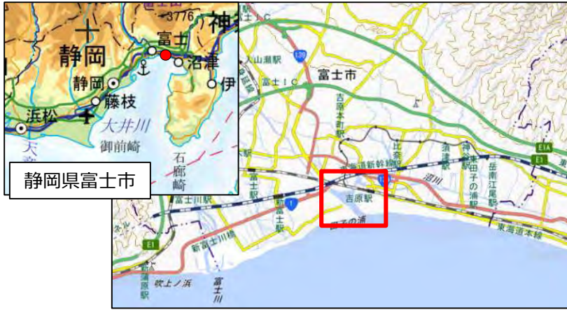
国土地理院地図（電子国土Web）( http://maps.gsi.go.jp )をもとに作成