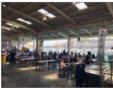
田子の浦港漁協食堂

★「田子の浦港漁協食堂」は、地理的表示（GI）保護制度に認定されている「田子の浦しらす」とともに、富士山と港の風景を味わうことが出来る他、鮮魚・海産物加工品や名産品なども販売しており、市内屈指の観光交流施設として国内外からの多数の観光ツアーも受入れています。