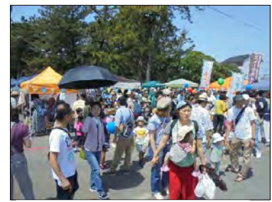
田子の浦みなとマルシェ