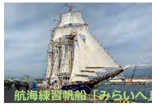
航海練習船「みらい」