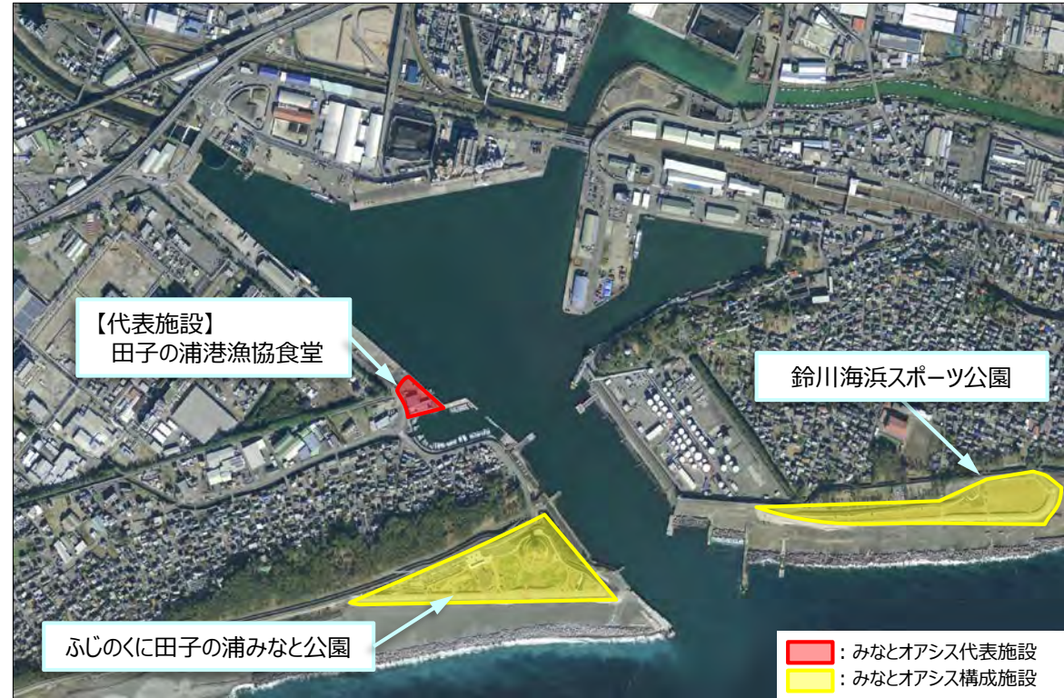
【代表施設】 田子の浦港漁協食堂