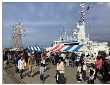
田子の浦ポートフェスタ