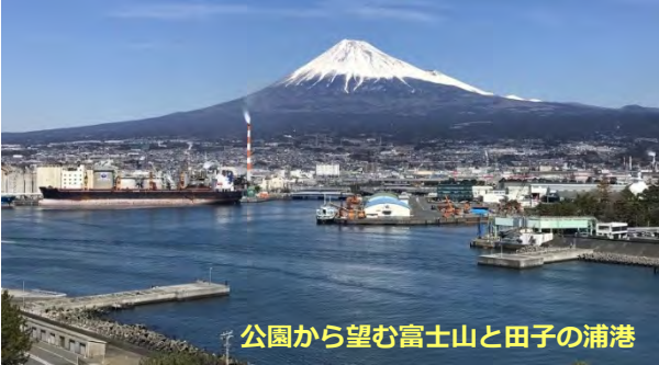
公園から望む富士山と田子の浦港