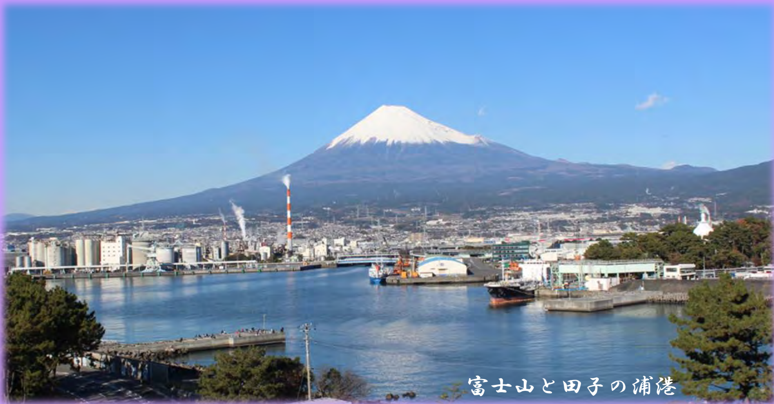
富士山と田子の浦港