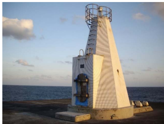
<伊豆大島に設置されている同タイプの灯台>