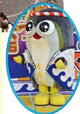
マスコット「まぐまぐ」