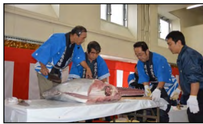
マグロ解体ショー(清水港マグロまつり)