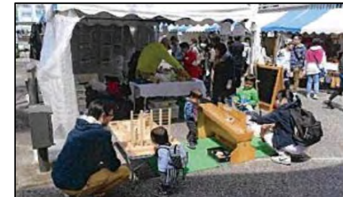
アートクラフトフェア