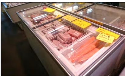
清水魚市場「河岸の市」でのマグロ販売

なお、6月17日（日）に代表施設『清水魚市場「 かし の いち 市」』（静岡県静岡市）において、「みなとオアシスマグロのまち清水」の登録証交付式を行います。