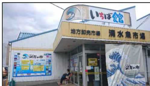
清水魚市場「河岸の市」