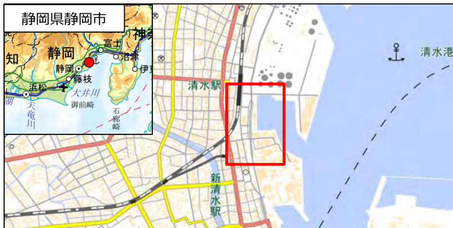
国土地理院地図（電子国土Web）( http://maps.gsi.go.jp )をもとに国土交通省作成