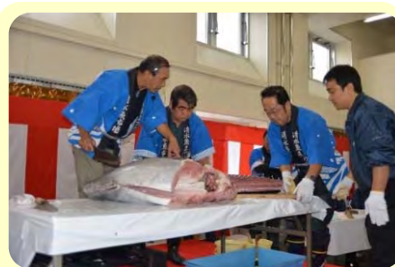
マグロ解体ショー