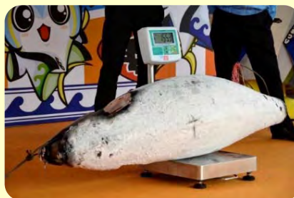
マグロ体重当てクイズ