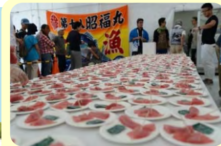
マグロのふるまい