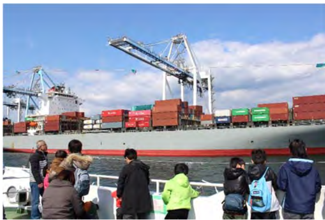
<コンテナ船を見学している様子(平成28年)>

我が国の経済にとって重要な物流機能の強化に加え、クルーズ船等による賑わい空間の創出に向けて動き出すなど新たな「清水港」の魅力を感じて下さい。