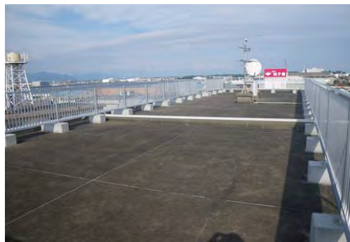
【駒越宿舎 B 棟 屋上】