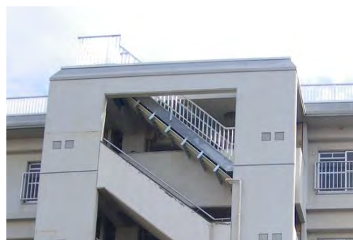
【新たに設置した屋上避難階段】