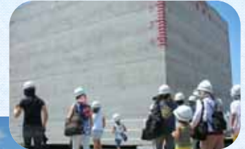
高さ11mのケーソンを間近で見学