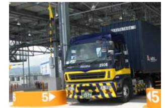
第1号車のゲート通過