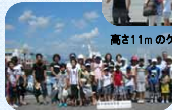
「まさき」にも乗船したよ！