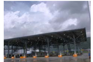
新興津コンテナターミナルゲート

私たち清水港湾事務所と致しましても、静岡県産業の国際競争力強化や急速な船舶大型化へ対応するため、新興津ふ頭第2バースの予算要求を進めています。今後も地元の皆さんと一体となって、清水港の機能強化に努めて参ります。