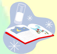
「はままつ少年の船」