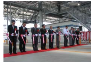
施主・来賓らによるテープカット