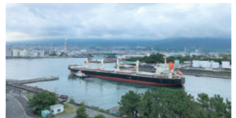
入港する石炭運搬船 (2021年6月)