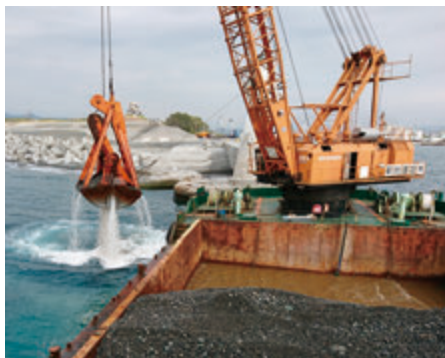
ポケットの掘削作業 (2019年4月)