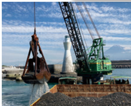
ポケットの掘削作業 (2021年5月)