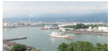
出港するセメント運搬船 (2021年5月)