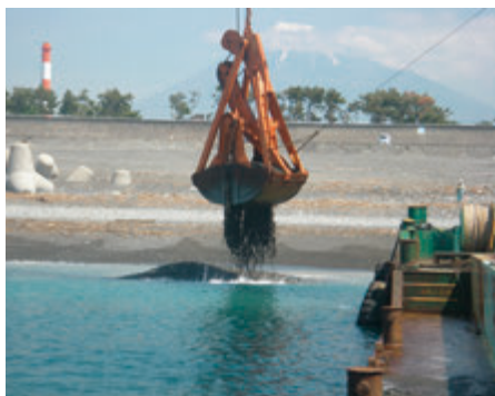
掘削した砂を活用した養浜 (2018年5月)