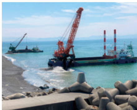
掘削した砂を活用した養浜 (2021年5月)