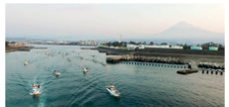
一斉に出漁するしらす漁船 (2018年)